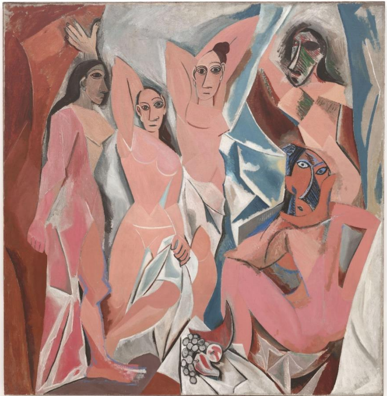
Pablo Picasso, Panny z Awinionu, 1907